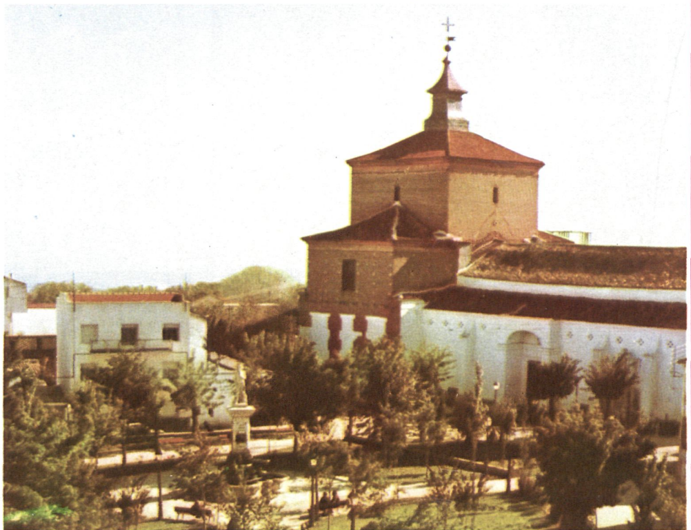
Iglesia de Santa María Magdalena