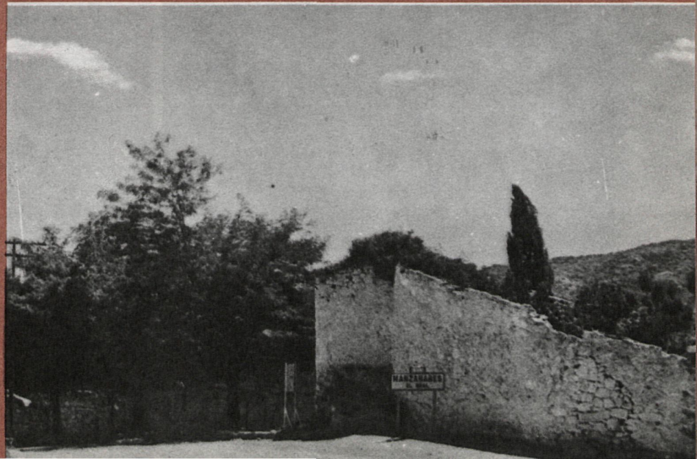
Fachada a la carretera ▼