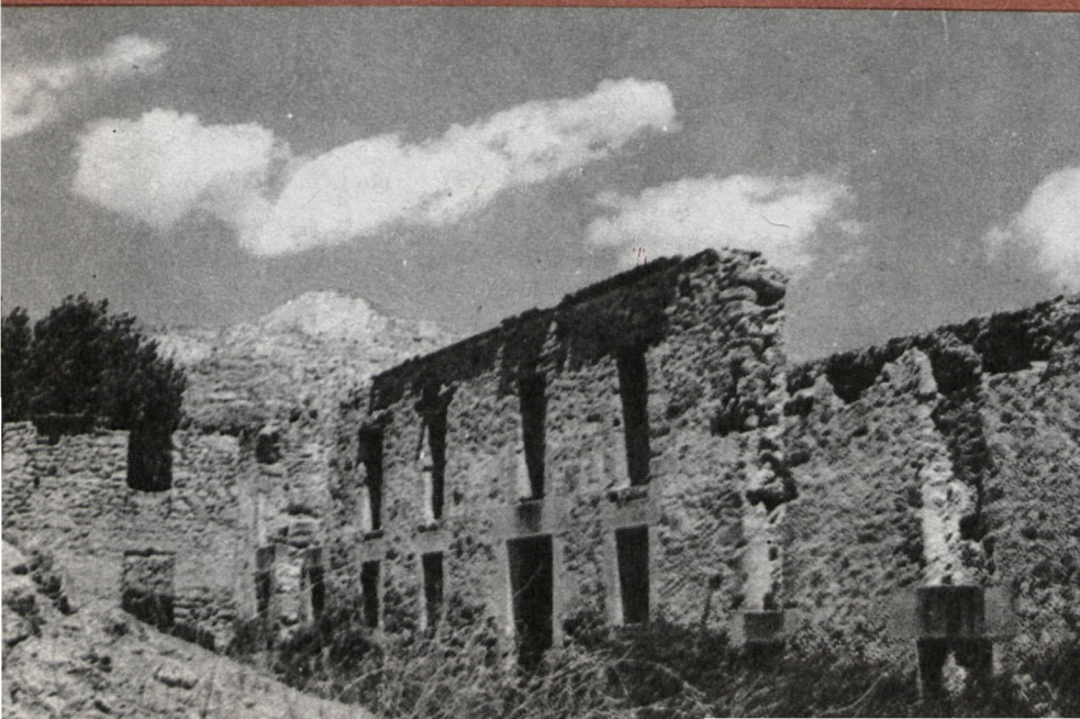
Vista del piso superior, que se destinaba al pesado y embalado del papel

Después de haberse aceptado durante muchos años la primacía cronológica de «La Esperanza» en