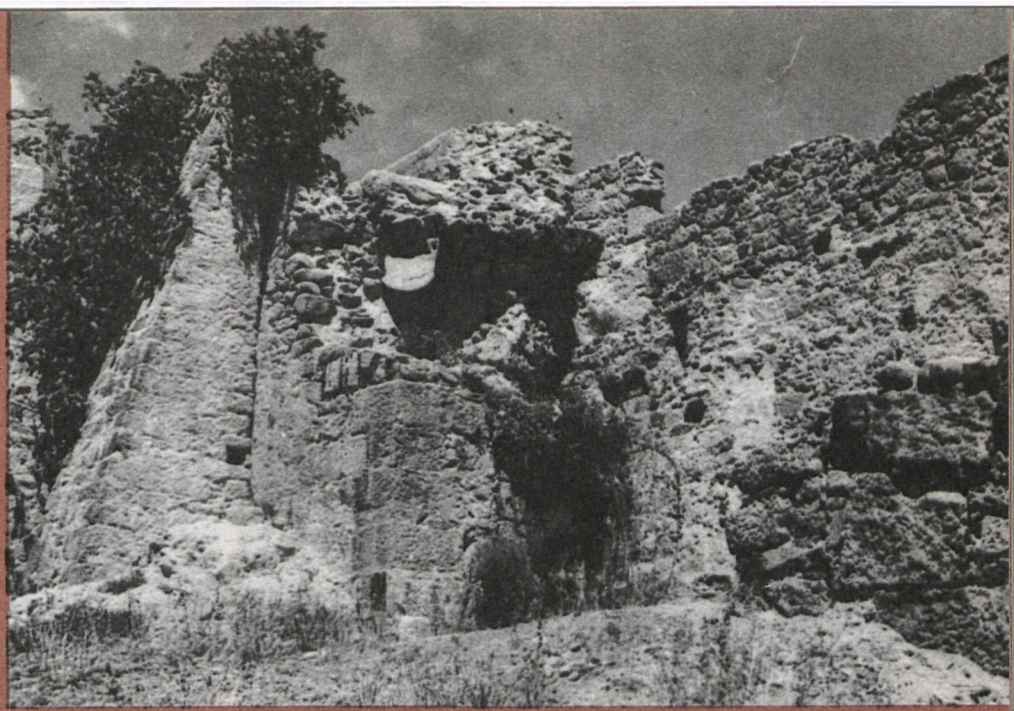
Emplazamiento de la caldera de leña