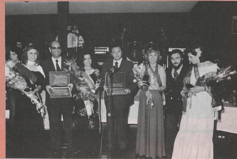
«Miss Castilla 77», «Lady Castilla 77» y sus damas de honor, en el momento de recibir sus distinciones