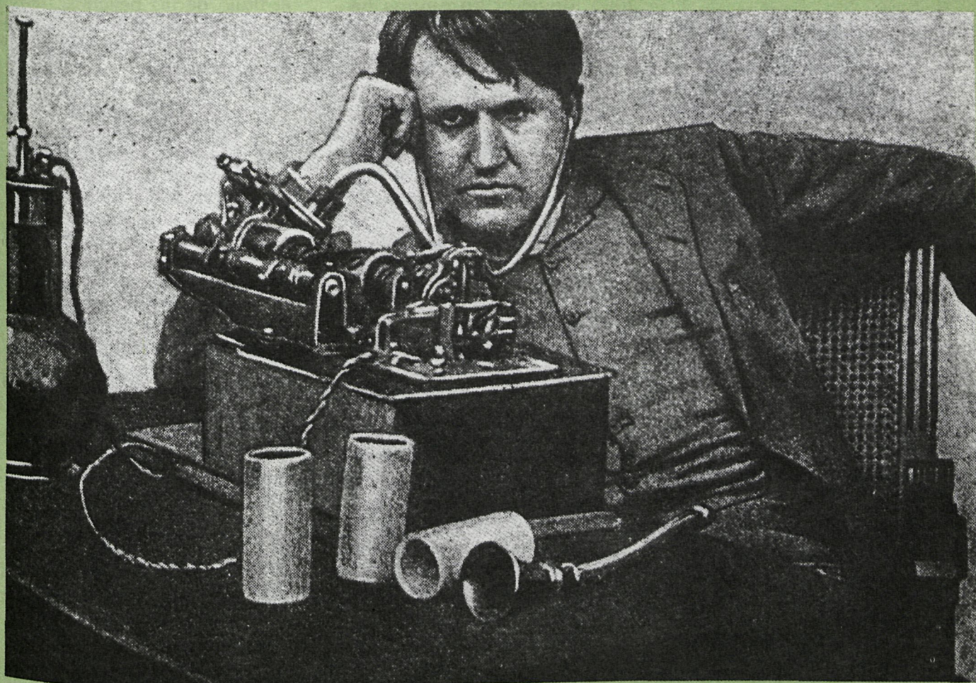
El quinetoscopio de Edison fue terminado en 1891. Era el resultado de experimentos en los que éste combinaba imágenes móviles con el fonógrafo inventado por él en 1877. Abajo: Edison y su quinetoscopio. Este era un cosmorama con el cual varios espectadores podían ver una cinta de quince metros

«CIRCO DE PARISH.—El debut de Mr. Rousby con su Animatómetro (sic), llevó anoche numerosísima