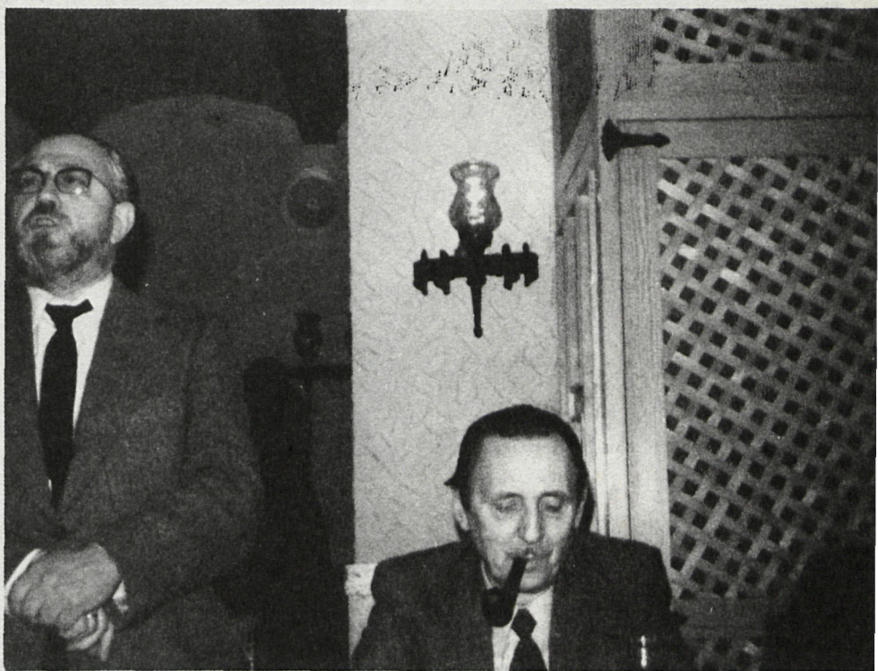
Antonio Buero Vallejo y el poeta Ramón de Garciasol interviniendo en otro acto del Ateneo va a los barrios y pueblos de la provincia

una realidad sobre otra realidad, todas concretas y conexas.