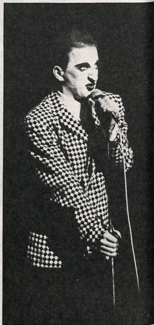
Como en un cajón de sastre, hay de todo en la Orquesta Mondragón: música, espectáculo, crítica social y hasta... histeria

■ «Estamos en la tensión del rock todo el día».