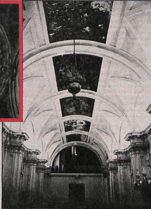
Aspecto parcial de la nave central, cuya restauración está prevista en la segunda fase