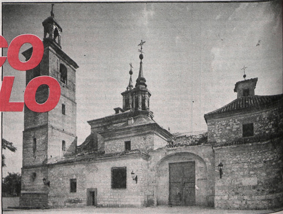
Fachada de la iglesia, en plena realización de las obras de cubiertas

En pocas ocasiones la historia del arte y de los hombres se reúnen en un edificio de buena arquitectura y de gran diseño, como lo prueba su arquitecto, Francisco Bautista, el arquitecto también de la catedral de