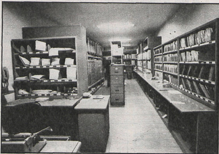
Depósito de Medios Audiovisuales, unidad de proyección fija, donde están catalogadas más de dieciséis mil series de diapositivas de 2.000 títulos diferentes

El Ministerio de Educación así lo ha entendido y viene dotando de aparatos a algunos centros, en otras ocasiones lo han considerado conveniente los propios centros, entidades o ayuntamientos y los han adquirido para dotar de los mismos a sus aulas de enseñanza, pero en cualquier caso siempre se ha tropezado con la dificultad de disponer de material audiovisual de paso al servicio de esos aparatos. Material costoso y que de nada sirve el contar con una pequeña dotación, porque entonces los aparatos no alcanzan un rendimiento eficaz, y si se intentara conseguir un fondo amplio, el importe del mismo sería tan elevado que sólo a unos pocos centros les sería posible conseguirlo.