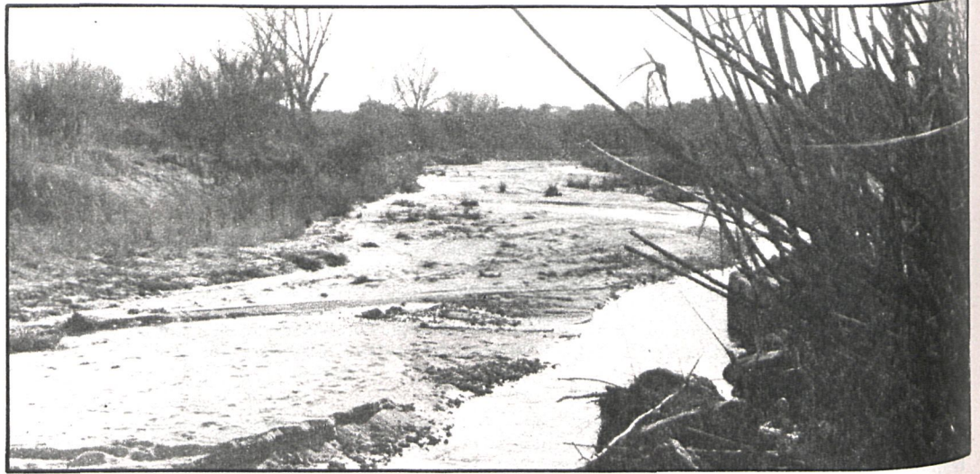
En Santa María de la Alameda y Robledo de Chavela preocupa la contaminación del agua

Guadarrama, la villa serrana descrita por Cervantes, es posiblemente una de las más limpias de la comarca, pues el Ayuntamiento dedica tres millones de pesetas anuales a la limpieza vial, independiente de la recogida de basuras. Atravesada por autopistas y carreteras nacionales, su resorte principal es la construcción, ahora algo paralizada por los factores económicos que afectan al país. Tiene algo de ganadería, buena calle comercial y se esfuerza por solucionar el problema del agua, cubriéndolo, además, por la autosuficiencia de sus manantiales. Con un censo de parados de unos 250, se encuentran en su territorio varios sanatorios, la Academia de Cabos de la Guardia Civil, etc. Pero se nota la ausencia del hogar para ancianos y jubilados, proyecto en vías de realización si el Municipio consigue el apoyo económico oficial y provincial que necesita. Otra obsesión es construir un Instituto de Enseñanza Media, en disputa con otros pueblos cercanos. Acaso quede todo en la ampliación prometida por el Ministerio correspondiente del Instituto de San Lorenzo.