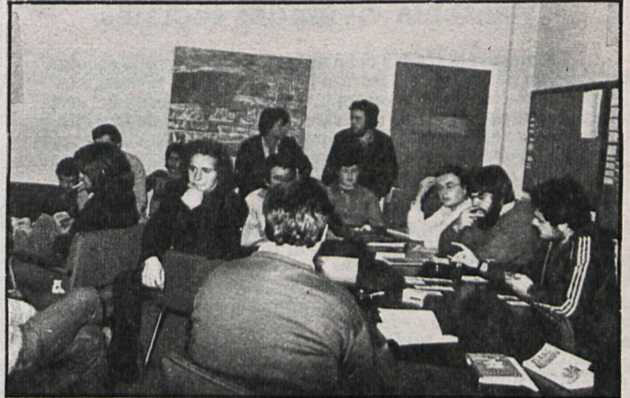
Huelga para un conflicto