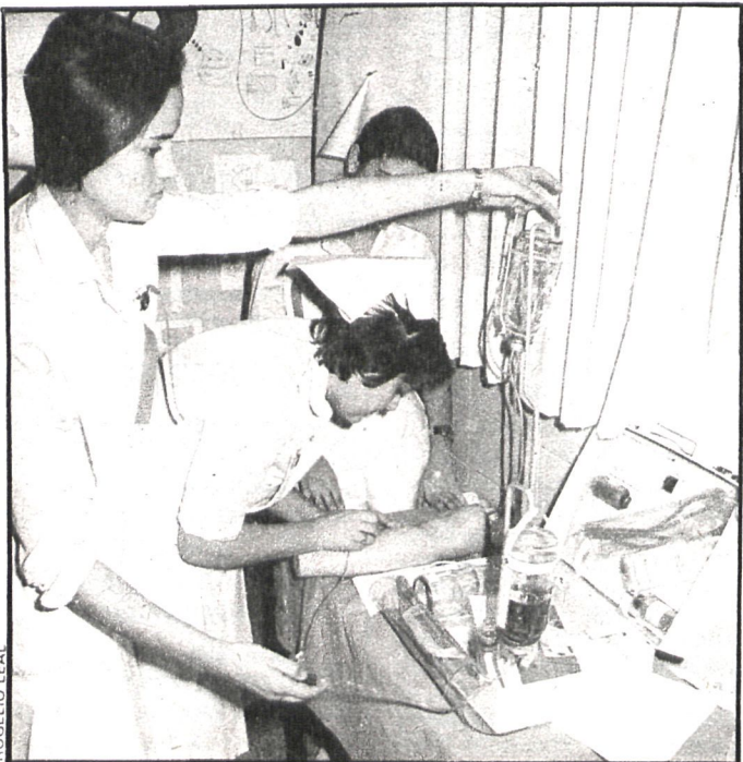
Colmenarejo tendrá clínica. En breve habrá subasta de sus obras

A Zarzalejo le ha dado buenas palabras el Consorcio de Aguas del Guadarrama, pero nunca se han cumplido. Se ha hecho un estudio geológico y se ha llevado adelante el proyecto, con la aportación de nueve millones de pesetas de la Diputación Provincial. En el verano, solamente se suministra una o dos horas al día. El alumbrado público es un desastre porque el viento suele derribar los cables. No han sido planificadas las calles y el alcantarillado es deplorable; a su vez, se proyecta ampliar el cementerio de este pueblo, cuyo sector principal es la cantería. El Ayuntamiento está compuesto por cuatro concejales de UCD y tres comunistas, de donde se deduce que las relaciones son tirantes. «Pero nosotros queremos que la Ley sea igual para todos, y esa es nuestra conducta», nos ha dicho el alcalde, de profesión pocero.