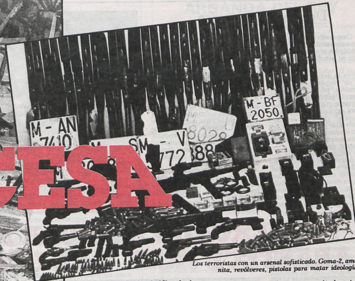
Los terroristas con un arsenal sofisticado. Goma-2, amonita, revólveres, pistolas para matar ideologías

denas, los bates de beisbol, los «luchacos» y si ha lugar, las pistolas. Algo se va definiendo y los grupos también.