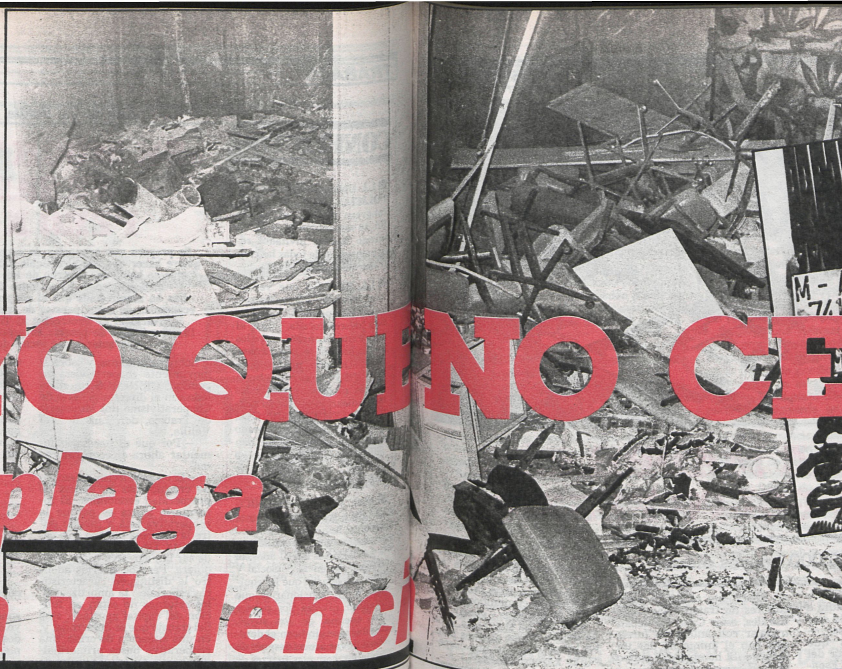
Aspecto de California, 47, tras la explosión. Pudo ser una noche de «cuencillos»

El terrorismo neofascista que surge en España a mediados de 1970 es, básicamente, un terrorismo orientado hacia la destrucción de librerías y de ataque a los curas progresistas. Tras los acontecimientos de 1975 se cambia la estrategia. Las coordinadas han cambiado. La extrema derecha utiliza las porras, las ca-