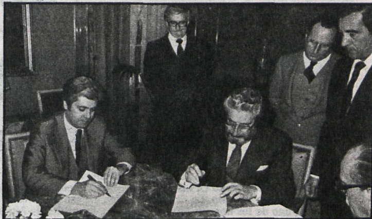
Momento de la firma del convenio de colaboración entre la Diputación Provincial de Madrid y la Universidad Complutense de Madrid

Por otro lado, la Facultad de Veterinaria de la Universidad Complutense contribuirá con profesores a distintos niveles, así como personal auxiliar