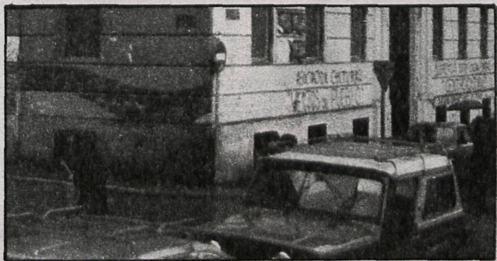
Las asociaciones culturales vallecanas piden a gritos, en las paredes, «casas de cultura». Mientras tanto, la droga sigue extendiéndose.

Un particular sólo tiene acceso a los nombres del primer escalón y, arriesgándose un poco físicamente, a los del segundo, pero no a los números uno. Sólo las autoridades podrían tener acceso a ello. Me resulta francamente extraño que en una sociedad supertecnificada casi sólo este aspecto de la realidad se «hurte» a las averiguaciones. Cuando, por mi función tutelar respecto a diversos muchachos, me he puesto en contacto individualmente con algún juez o policía, me han dado una imagen desoladora del problema: «No se preocupe, tomaremos medidas; esto va despacio...» Parece como si el ver a los críos de diez o doce años «oliendo» pegamento en cualquier calle de Vallecas no preocupara a nadie, como si a nadie le importarían los estragos que en la ju-