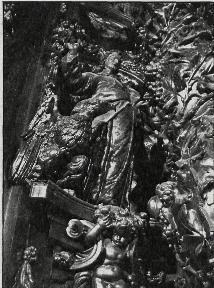
Detalle del retablo mayor, en que puede apreciarse la maravillosa figura de San Juan y otros adornos, elementos del quehacer artístico de Churriguera

doró el retablo de San José de dicha iglesia. El retablo de José Benito Churriguera es una de sus más bellas muestras de arte, poniendo todo su ingenio al servicio de la figura del Salvador en la Transfiguración, que es el tema del lienzo central, obra de Leonardoni, cuadro que pintó el veneciano