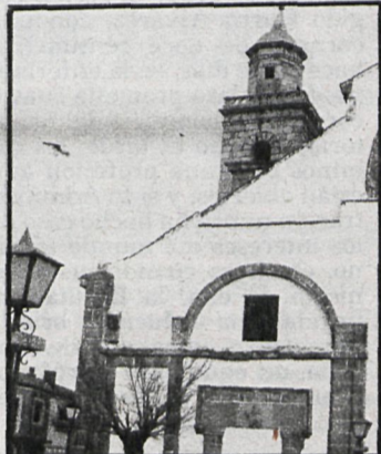
San Martín de la Vega espera las ya cercanas fiestas

Se encuentran en período de exposición, en el Ayuntamiento de Villarejo, los proyectos de alumbrado parcial de la calle principal y accesos, aprobados en el último pleno, obras que suponen un total de más de seis millones de inversión. También se han puesto en marcha las obras de acondicionamiento del local destinado a Mercado Municipal, situado en una planta baja de la plaza de España, propiedad del Ayuntamiento.