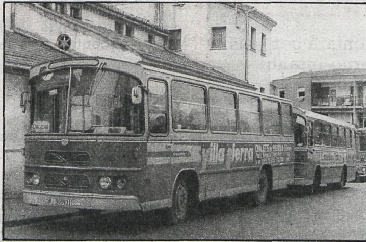
Guadarrama: Llegaron los autobuses

Como dijimos en el número anterior, el presupuesto municipal de El Escorial fue aprobado, aunque con alguna reticencia del concejal comunista, que alegó deficiencias de forma, y algunas precisiones de los socialistas. Pero la cuestión