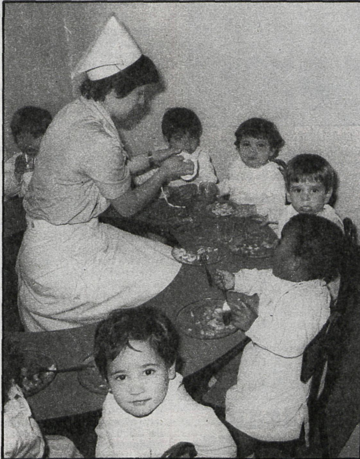
Leganés: El desarrollo del niño preocupa desde su mismo nacimiento

te de información y formación analizará la marcha del centro con los propios afectados, con el objetivo de ir corrigiendo errores y adoptar las modificaciones estructurales necesarias en cada momento.