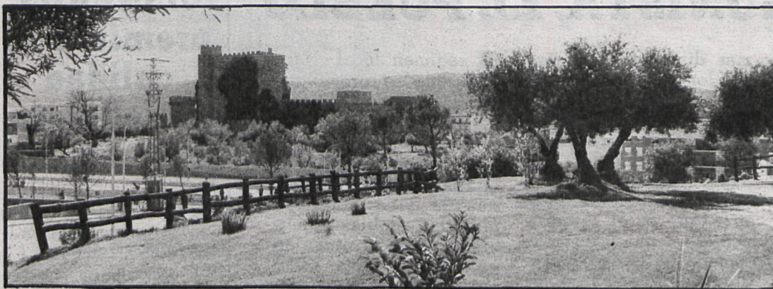
Frente a este paraje se construirá el centro para subnormales