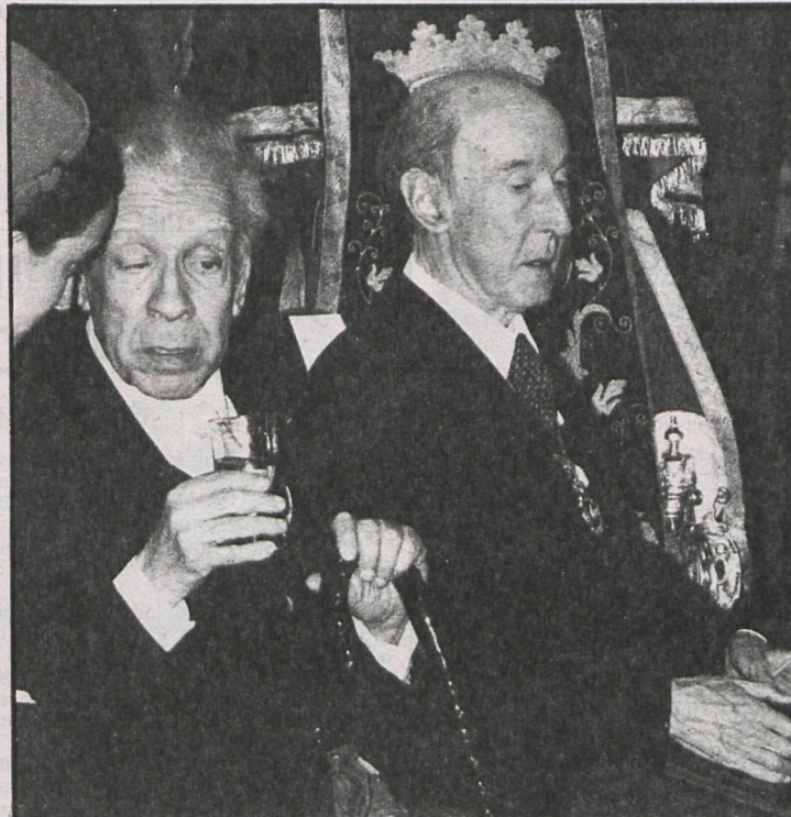
Jorge Luis Borges y Gerardo Diego, ganadores «ex aequo» del premio

Gerardo Diego subió a la cátedra y desde allí se dirigió a los presentes. Comenzó diciendo «Recibir el premio me parece un sueño durmiente, pero al comprobar que es un sueño