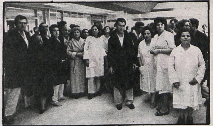
Los enfermos del «Piramidón» se concentraron en el hall del hospital