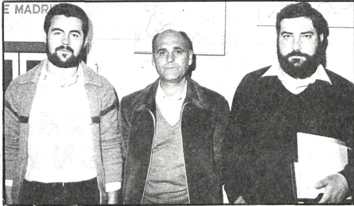
Los trabajadores que llevan las gestiones de la cooperativa Pavimentos Alcalá

«En cuanto al éxito de la misma, hemos estudiado el mercado, sus posibilidades de venta y cantidad del producto, de tal forma que aun teniendo tres máquinas automatizadas sólo utilizaremos dos, ya que el mercado marca la limitación en la producción. Por otro lado, al habernos quedado con parte de la red comercial de la