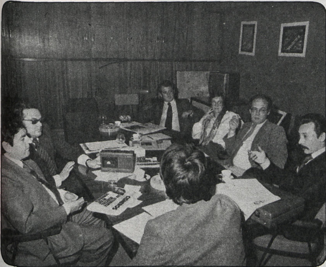
Técnicos y políticos, en torno a un tema polémico

inmaduros, y cuanto más graves son los delitos, más inmaduros.