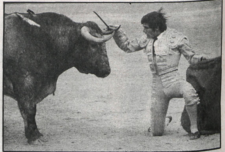
San Isidro, última semana