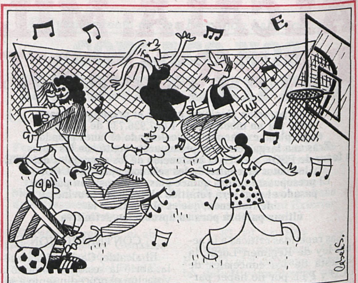
En el polideportivo Juan XIII, de Móstoles, los fines de semana se celebrarán bailes para los jóvenes a precios populares