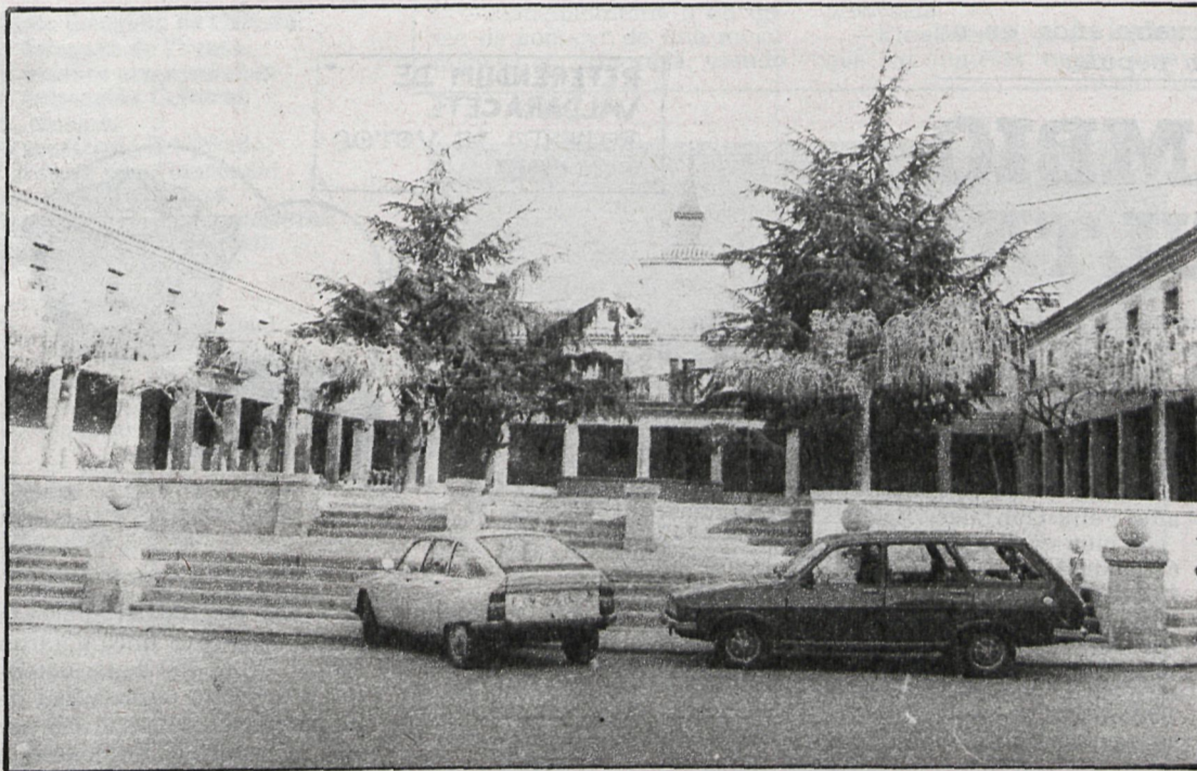
Los ediles de Las Rozas todavía discuten la composición de las comisiones

Muchos temas de interés, aparte del expediente de delimitación de polígonos de actuación del Plan Especial de Las Matas A y B, cuestión que ocupó una parte importante de los últimos plenos del Ayuntamiento de Las Rozas, y que se llegó al acuerdo anónimo de que se tramitara de oficio por el Ayuntamiento un proyecto de «poligonación» del citado Plan Parcial. También se acordó al respecto facultar plenamente a la comisión informativa de Urbanismo y Obras para que una vez estudiado detenidamente el asunto, proponga a la corporación las actuaciones más procedentes a llevar a cabo.