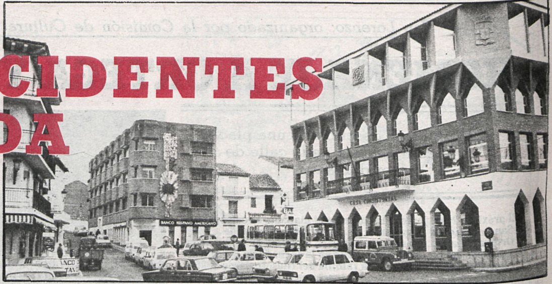
Los hechos provocaron la tensión en el pleno del Ayuntamiento

Fuerza Nueva, con sus preguntas, provocó un pleno tormentoso y una denuncia de la Corporación por el debate del plenario