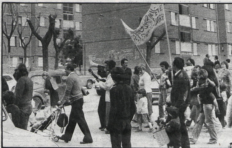
Educadores, partidos y padres apoyan la popular guardería de San Blas