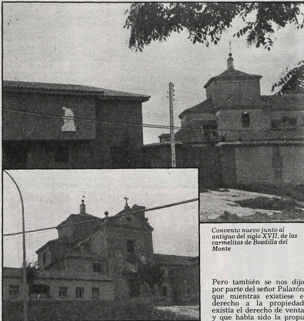
Convento nuevo junto al antiguo del siglo XVII, de las carmelitas de Boadilla del Monte