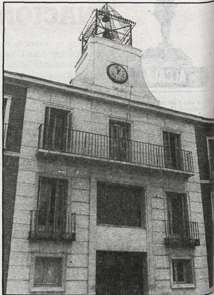
Desde el Ayuntamiento se pide el desvío de la carretera de Andalucía por la zona Oeste

El Ayuntamiento, ante la actitud de los grupos, llamó a la Policía Nacional para que reti-