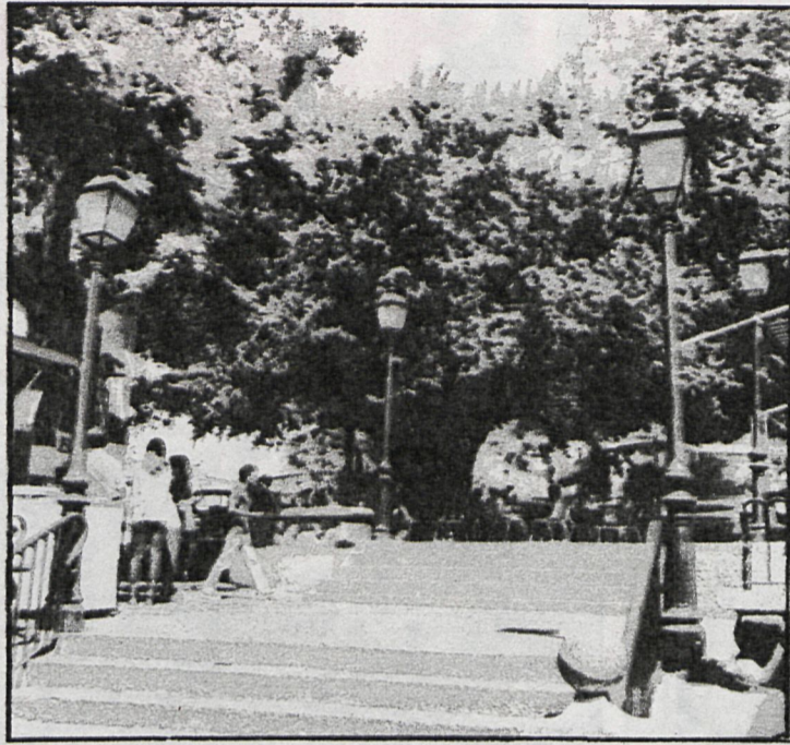
Colmenar Viejo, pueblo pionero de las vacaciones en la Sierra

Salimos de Madrid por la 607, hoy autopista hasta Colmenar Viejo. La población es de fundación antigua y siglo a siglo se ha ido desarrollando por el esfuerzo y trabajo de sus paisanos, gentes serias, austeras, cordiales y generosas. La altura media, 900 metros sobre el nivel del mar. Limita con los municipios de Manzanares el Real, Soto del Real, Guadalix de la Sierra, Madrid, San Se-