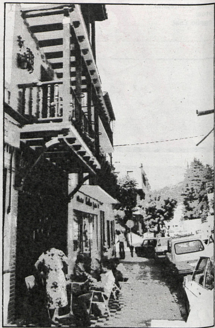
Navacerrada, en enclave de mayor belleza, se mira con gallardía en las aguas de su embalse

También tiene unos hermosos lugares de esparcimiento. Y sus monumentos nacionales propios, como esa iglesia parroquial, que una servidora, con permiso de todos ustedes, ha denominado siempre catedral, con todas las de la ley, aunque como tal haya pasado inadvertida. Está dedicada a la advocación de la Asunción, y hay quien la llama «catedral de