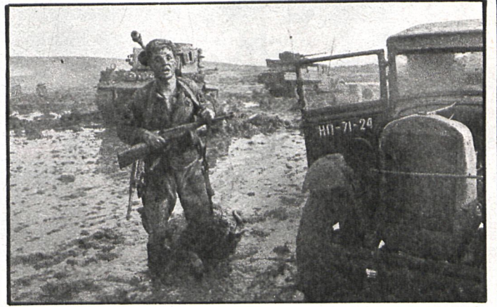
Fotograma de la película rusa «Siberiada», del director Andrei Mikhalkov