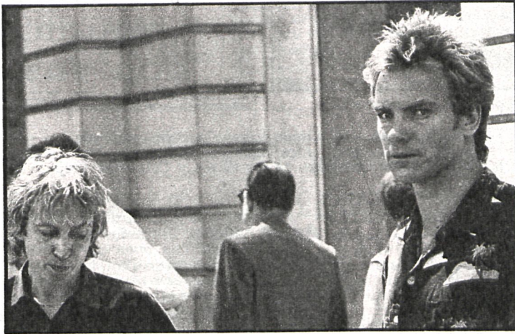
En las calles de Madrid, el guitarra de Police, Coppeland (a la izquierda), y el cantante Sting pasaron inadvertidos. Eso sí, posaron para CISNEROS

The Police, la gran revelación del año ochenta en todo el mundo, descargó su potencial musical el pasado domingo 31 de agosto en el estadio Román Valero de Madrid. Después de una serie de desafortunados conciertos, que no llegaron a celebrarse, éste último ha sido, sin lugar a dudas, uno de los más importantes —si no el mejor, por la calidad de Police— de los festivales realizados en Madrid en todo el año. La organización parece haberse esmerado después de las anteriores lecciones, y todo salió perfectamente, a pesar de la gran cantidad de público que acudió a ver a las nuevas estrellas del pop.