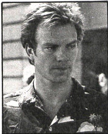
Sting (el «as de oros» en la película «Quadrophenia»), cuya voz metálica asombra al mundo

Una larga e intensa preparación: cambios de equipo, un montón de técnicos esparcidos