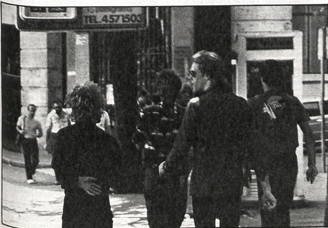
El paseo madrileño de Police, horas antes de su inolvidable actuación en el Moscardó