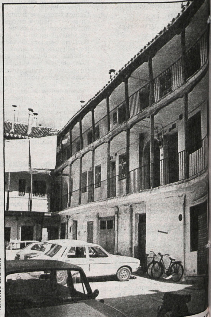
El plan especial del casco antiguo de Aranjuez tiene por objeto salvar la zona de especial tipismo. En el resto del municipio la construcción pro-

En Arganda, tras la entrada en el Ayuntamiento de la última corporación, se ha in-