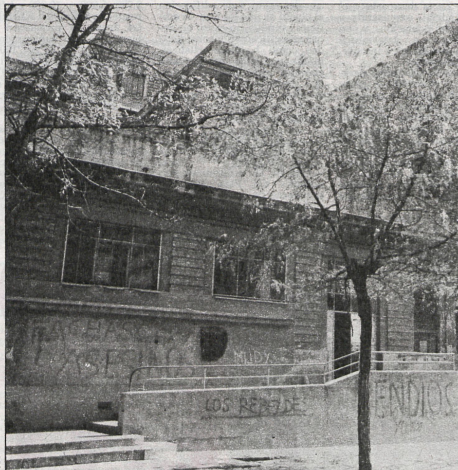
El deterioro del exterior del edificio de Mantuano es patente. Los camiones de basura que han salido por esta puerta han dejado patente de que en el interior las cosas no estaban en mejor estado

La historia del polémico Centro Cultural de Chamartín es uno de los tantos episodios que ocurren por dejadez de la Administración. La antigua Escuela de Mandos José Antonio (antes Escuela Nacional Nicolás Salmerón, inaugurada en 1932) clausuró sus actividades al disolverse el Movimiento. En el año 1976 pasó a manos del Ministerio de Cultura. Este organismo designó un director-encargado que propuso al Ministerio la creación de un centro cultural. El director fue cesado posteriormente y la responsabilidad del Ministerio con respecto al edificio parece acabar en este punto. No se vuelve a ocupar el cargo de director y, paulatinamente, se van retirando los conserjes, las señoras de la limpieza y, finalmente, se corta la luz, alegando inseguridad en el edificio. Y aquí comienza la degradación del inmueble