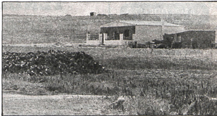
Los modestos «chalés» se alzan en las parcelas de Fuentidueña

Hace algo más de un mes que la empresa Ripemsa, S. A., fue sancionada por el Ayuntamiento de Fuentidueña con una multa de 100.000 pesetas por la parcelación ilegal de unos terrenos calificados de secano y dentro del término municipal que están siendo vendidos como parcelas de regadío.)