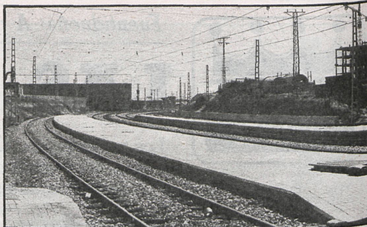
El recorrido del ferrocarril y los consiguientes pasos a nivel elevado son causa de enfrentamiento entre el Ayuntamiento de San Lorenzo y Renfe

«Estoy plenamente satisfecho —ha señalado el alcalde—, entre otras cosas porque ha demostrado la honestidad de este Ayuntamiento cuando concedió la licencia de obras, que después absurdamente se ha puesto en entredicho. Era una licencia más entre las muchas que se conceden, pero con la singularidad de que favorecía grandemente al pueblo. Usted sabe que desde un principio mantuve la convicción de que la licencia estaba bien concedida y que, a pesar de la tormenta que se desencadenó después, sostuvimos nuestra tesis contra viento y marea. La sentencia garantiza que no estábamos equivocados nosotros, sino ellos, y que la instalación del camping sólo puede traernos beneficios.»