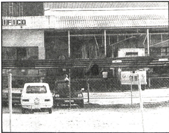
Los residuos arrojados a un vaciadero anexo al matadero pasan a un arroyo, y de allí, a Móstoles

poco se va haciendo con el control de la empresa. La familia Trujillo desaparece. En 1973 aparece en el Registro Mercantil la primera liberación de acciones a favor de esta empresa, y otra en 1975. Desde entonces no se registra ningún movimiento de acciones relacionados con Estrella Internacional. Sin embargo, fuentes de COFRIMASA han negado la existencia entre sus accionistas de ninguna otra empresa, insistiendo en que todos los accionistas son particulares.