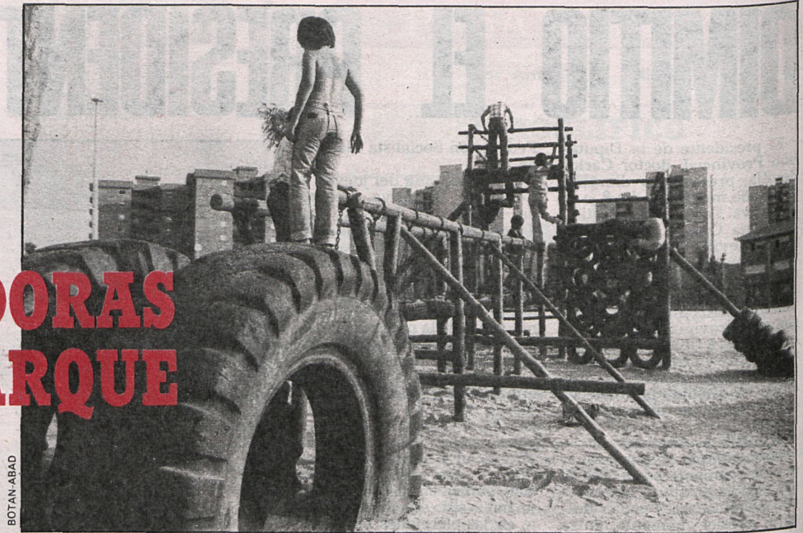
El parque Salvador Allende, que acaba de inaugurarse, tiene 40.000 metros cuadrados, responde a nueva concepción en este tipo de construcciones y beneficiará a los vecinos de más de 4.000 viviendas

El barrio Valleaguado había sido construido sin zonas verdes, bocas de riego y apenas alumbrado. La Corporación municipal obligó a las 25 empresas responsables a pagar el coste del parque Salvador Allende