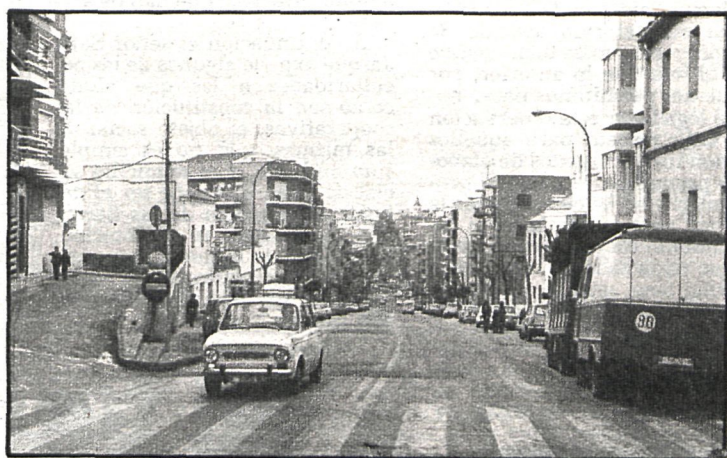
Circuito urbano de San Sebastián de los Reyes, permanente lugar de prácticas de los muchachos de La Unión

Ciento noventa socios con cuotas mensuales de 50 pesetas para adultos y 25 pesetas para niños