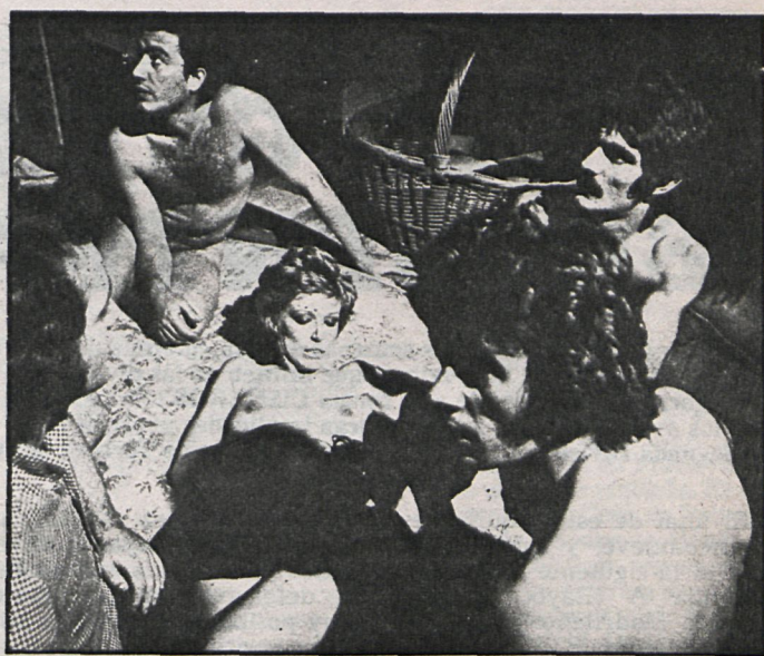
¿Porno o erótico? Una sombra nos lo impide ver

Desde hace cuatro años, los exhibidores esperan una ley reguladora