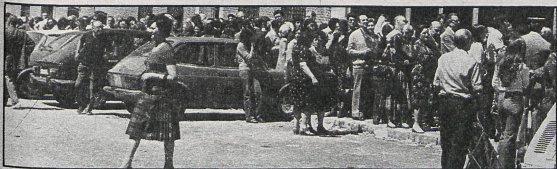
Mientras el paro aumenta de forma alarmante, los privilegiados de siempre y los nuevos arribistas acumulan cargos para mantener su poder adquisitivo. Los ciudadanos así no van a creer nunca en que la democracia es el mejor de los sistemas políticos conocidos