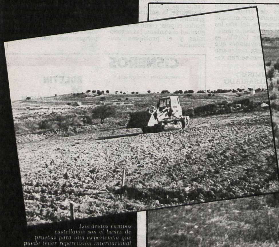
Los áridos campos castellanos son el banco de pruebas para una experiencia que puede tener repercusión internacional