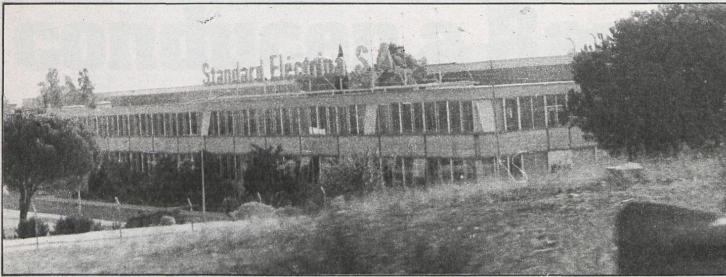
Los sectores más afectados por la crisis son la construcción y el metal