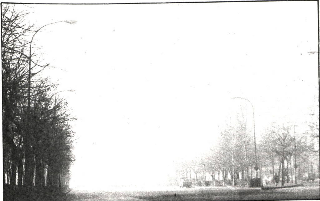
El año 81 ha empezado con problemas de contaminación y dolor en la provincia