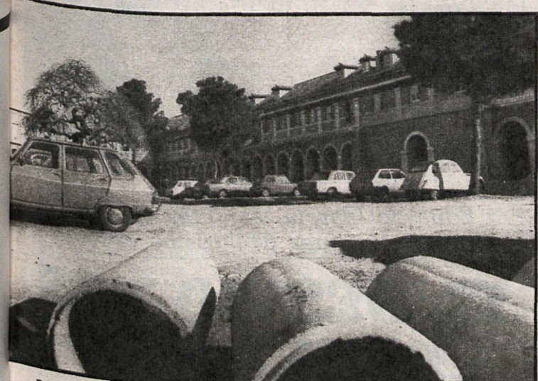
Patio de Caballeros. Las obras en el Real Sitio se han hecho habituales desde la entrada de la izquierda en la Corporación. Algunas de estas obras (la de la variante de la N-IV) no gustan a algunos sectores

Así será el nuevo Aranjuez después de la realización de las obras en la carretera de Andalucía