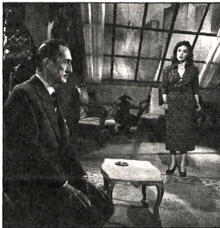
«Cómicos», primer filme de Bardem

Bardem se convierte luego en un realizador al servicio de