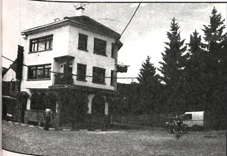
Los hotelitos —como el de la foto, captado en Navacerrada— son la tónica dominante de Bustarviejo, habiéndose salvado de la especulación del suelo

son escasas las trabajadoras fuera de sus casas. «Solamente —explica— unas cuantas jóvenes del pueblo trabajan en la fábrica de fermentos CIP-SA. Sin embargo, creemos que si sería oportuna la creación de plazas para preescolar. Ahora, la Asociación de Padres de Alumnos se está ocupando de esta enseñanza, pero de una forma más bien privada.»