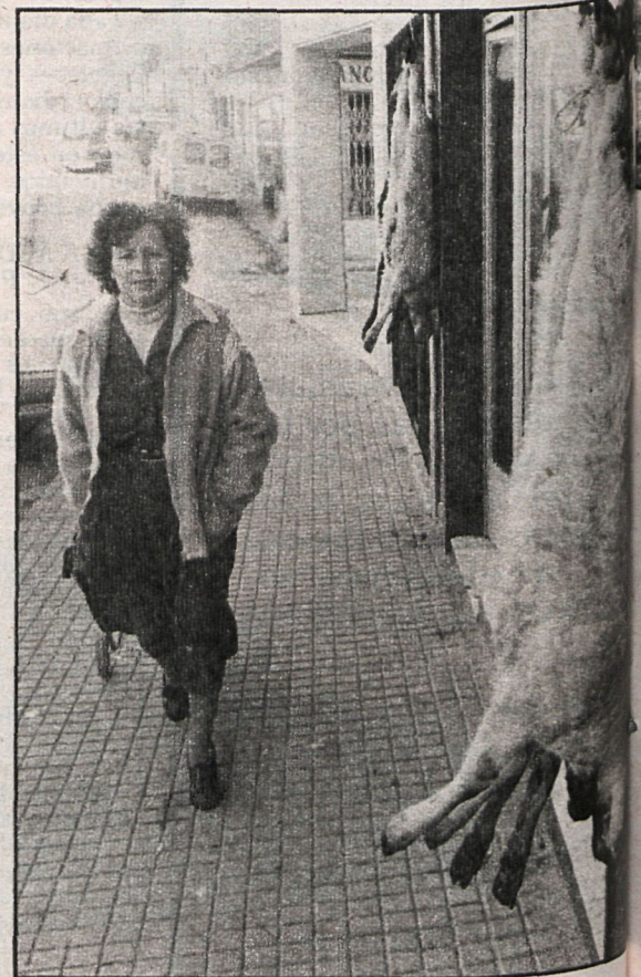
El consumidor se verá afectado fatalmente por las repercusiones del monopolio al que se encaminan los mataderos frigoríficos promovidos por la propia Administración

El Ministerio de Sanidad y Seguridad Social debe saber que, concretamente en la provincia de Madrid y, sobre todo, en la zona eminentemente ganadera, el 30 por 100 de las explotaciones están siendo gestionadas por personas con