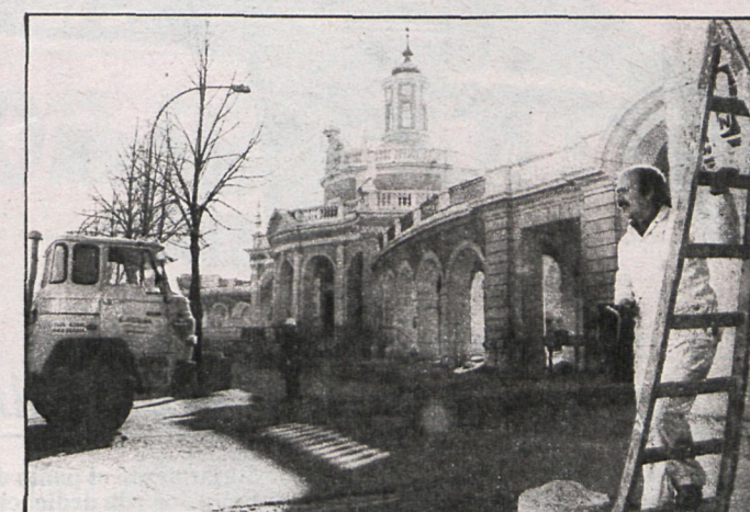
Uno de los puntos conflictivos de la provincia: la carretera de Andalucía a su paso por Aranjuez. La variante polémica es esperada por vecinos y Ayuntamiento con urgencia

En marcha las principales obras de la red viaria madrileña a cargo del MOPU