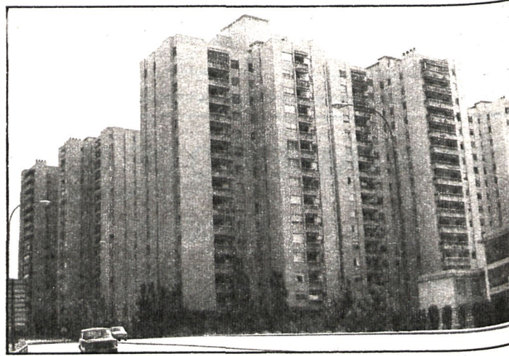
Arreglar un caos urbanístico heredado cuesta un alto precio al Ayuntamiento de Fuenlabrada

El Ayuntamiento de Fuenlabrada sólo está adeudando hasta la fecha el 1,8 por 100 sobre el presupuesto señalado, cifra sensiblemente inferior a la de otros municipios del Área: Parla (11,66 por 100), Le-