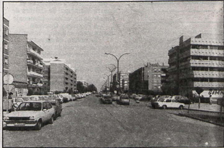
El desarrollo urbanístico de numerosos pueblos se está programando actualmente con participación de los afectados

La revisión del plan va a ser financiado en el 100 por 100 por Coplaco, reservándose la Diputación el papel de asesor técnico. Los ayuntamientos formularán sus respectivos planes y una vez contratados los urbanistas irán recibiendo el dinero necesario a través de transferencias de capital, pre-