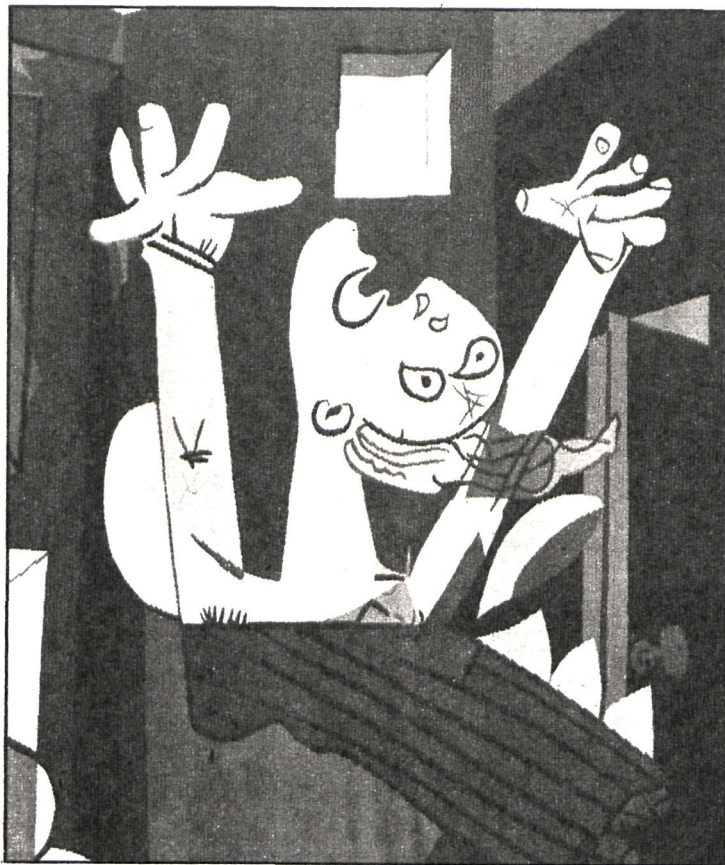
Getafe recuerda hoy más que nunca la vida y la obra del inmortal autor del «Guernica»

Como realizaciones más urgentes, incluidas en el programa de actuación municipal, están previstas las siguientes: instalación de cinco bibliotecas públicas en otros tantos barrios de la localidad; entrada en funcionamiento del centro