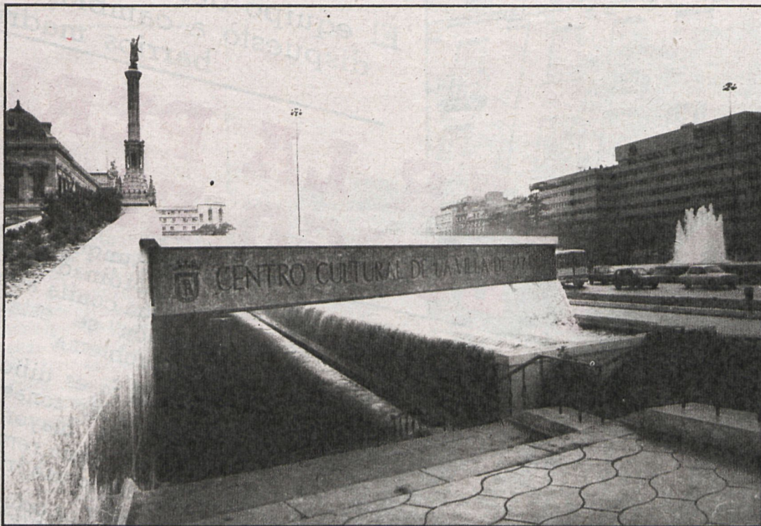
Centro Cultural de la Villa: uno de los servicios de mayor calidad en el terreno educativo, que este año se verá potenciado

Para Joaquín Leguina, concejal de Hacienda, la postura de UCD no tiene razón de ser. «Nosotros creemos que hay que recuperar el sentido lúcido y