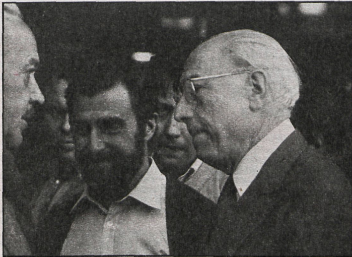
El alcalde de Madrid ha mantenido desde un primer momento una actitud de diálogo y comunicación con los ciudadanos, que se verá complementada por la nueva campaña municipal

Con la denominación de «Campaña de imagen y publicidad del Ayuntamiento», la delegación de Relaciones Sociales y Vecinales recoge en sus presupuestos para este año una partida que asciende a cincuenta millones de pesetas, que ha sido objeto de diversas críticas