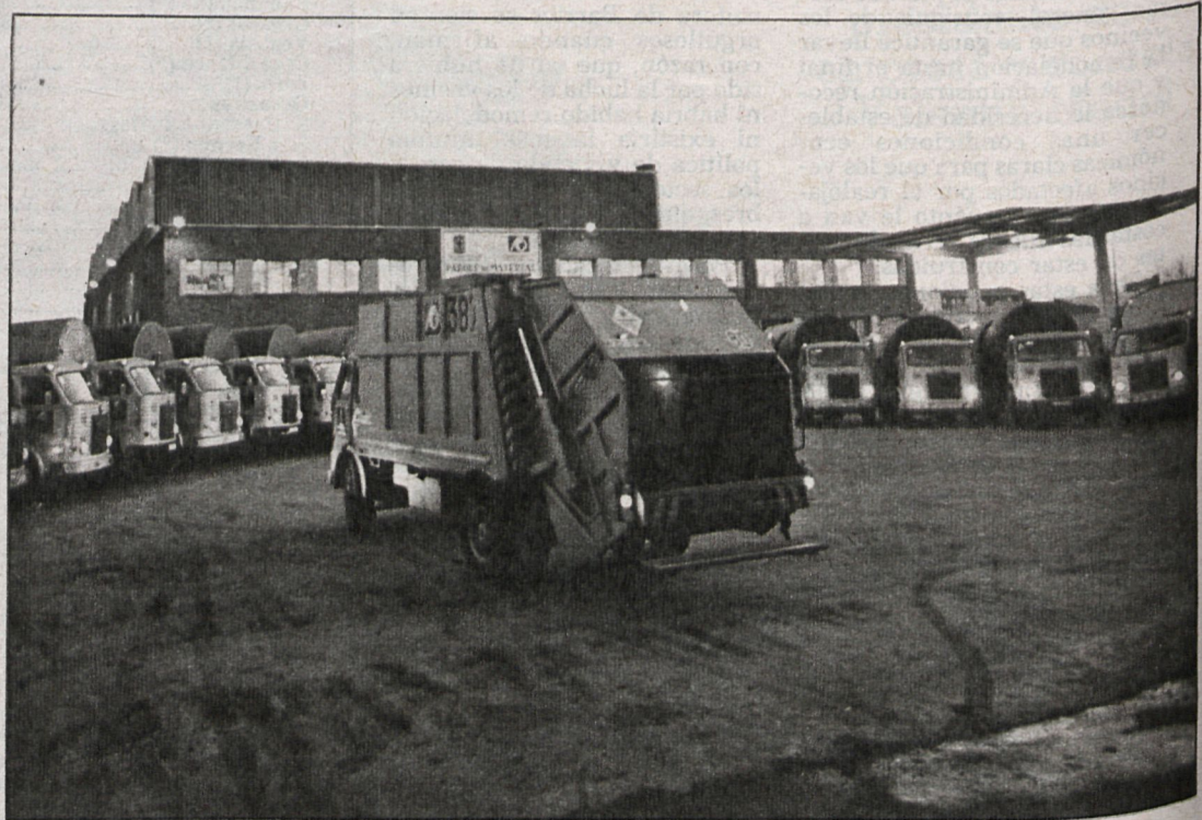
Mantener una ciudad limpia, con un eficaz servicio de limpiezas, es fruto de la colaboración, desde el punto de vista económico, de todos los ciudadanos