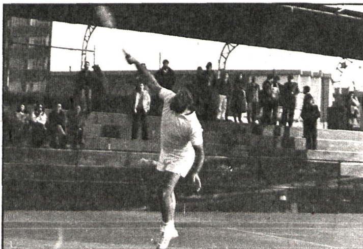
Dentro del programa de construcciones se incluyen ocho pistas de tenis situadas en el complejo polideportivo

Para la financiación del programa de construcciones deportivas previstas, el Ayuntamiento de Fuenlabrada va a recibir dos subvenciones económicas, una de 25 millones del Consejo Superior de Deportes y otra de 30 millones de la Diputación Provincial.