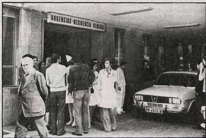
Los centros de urgencia, atestados de enfermos que están, o creen estar, afectados por la neumonía atípica