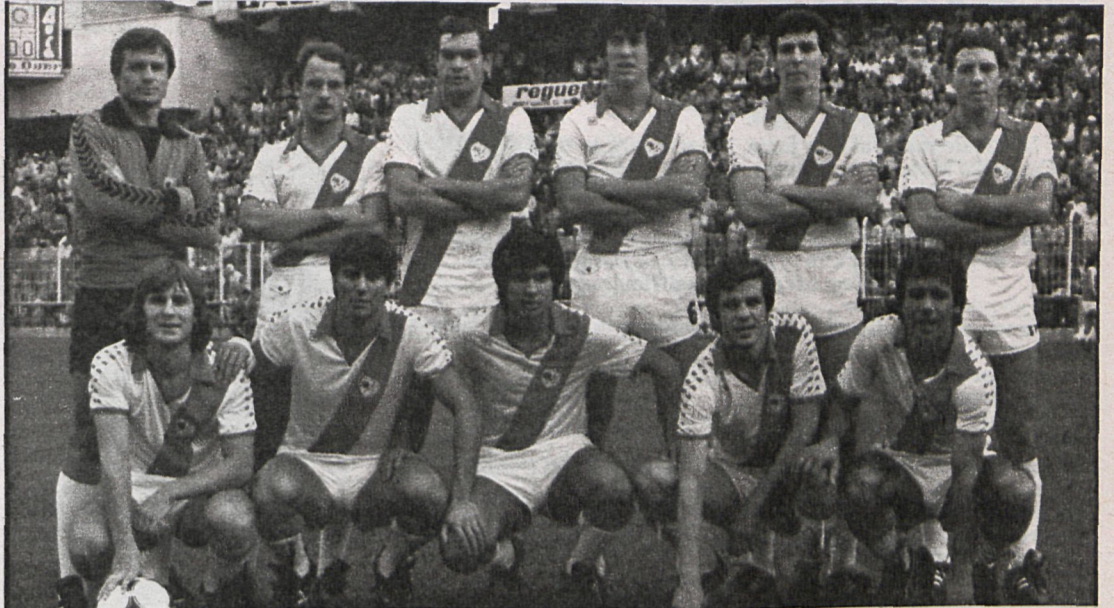
El popular Rayo, único equipo de la provincia con aspiraciones a Primera División, se quedó en su categoría a pesar de la temporada brillante 80-81

Magnífica campaña del Aranjuez y Moscardó en la Tercera División