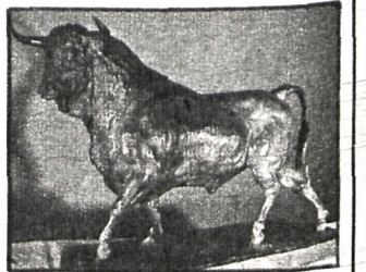
Exposición Los Toros (su testimonio en algunos artistas españoles), en sala Miguel Ángel

Martio Antolín destaca las calidades de este artista: «Sus terracotas poseen la difícil belleza de una ejecución apasionada, pero medida de elegancias eternas. Morales traspasa a sus figuras una fuerza expresiva poderosa en una rara mezcla de búsqueda inquietante y clasicismo. El barro se ennoblecce y agiganta. Todo está equilibrado. Emoción y armonía. El juego de la forma se hace claro en sus manos. Un viejo simbolismo se adormece en el barro y el escultor reinventa la belleza.»