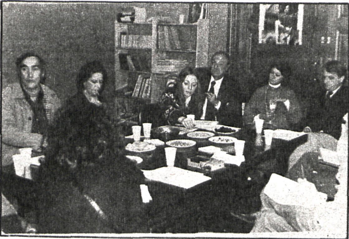
Momento de la rueda de prensa celebrada para presentar el XIX Festival Internacional de Teatro

Los temas teóricos a desarrollar a través de seminarios serán: «La comunidad del teatro y las artes tradicionales»; «El papel irracional del teatro en la sociedad»; «La defensa del artista»; «La expresión escénica integral hablada, can-