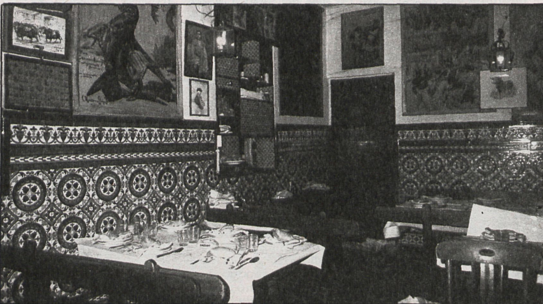
Este año, las peñas taurinas están como nunca. El Malacatin, restaurante torero donde los haya, es sólo un ejemplo del aumento de la afición, que no siempre se ve recompensada por un incremento de la calidad.