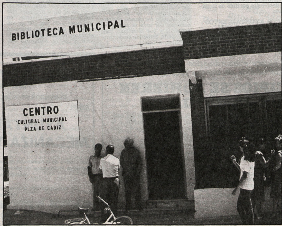
Biblioteca-Aula de Cultura Gloria Fuertes, donde se celebró el acto de inauguración de las tres nuevas bibliotecas

La Diputación Provincial de Madrid ha colaborado financieramente en la apertura de estas tres bibliotecas municipales de Fuenlabrada.