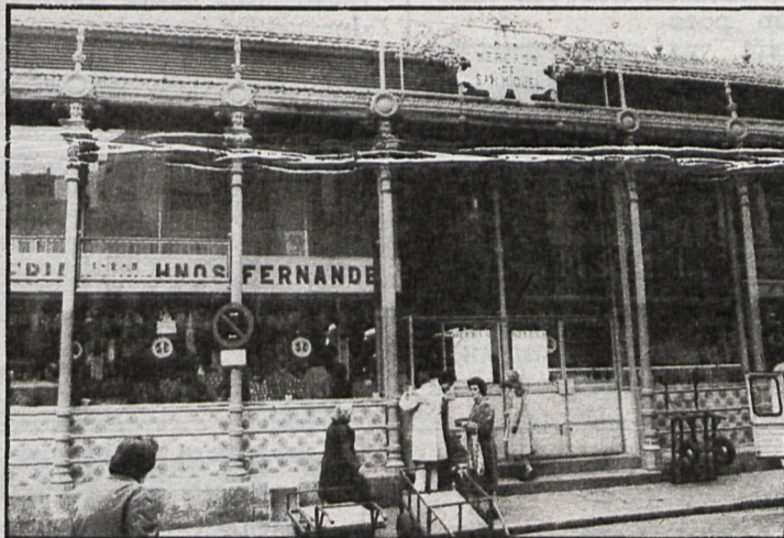
Los mercados de Madrid son los únicos de la provincia en los que se sigue un estricto control sanitario

La Delegación de Abastos y Mercados del Ayuntamiento de Madrid considera los precios máximos y mínimos de los productos que se comercializan