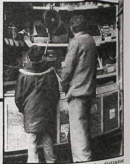
Los precios de los productos en los distintos mercados no varían demasiado, pero se puede afirmar que en Aranjuez y San Lorenzo es donde hay precios más altos

Preocupante situación sanitaria de los mercados, exceptuando la capital de España