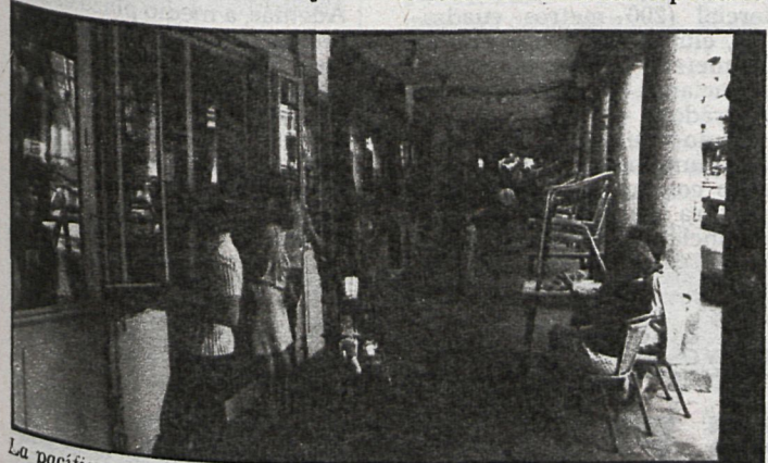
La pacífica villa escurialense vivirá una «invasión» de jóvenes y menos jóvenes que exaltarán la guerra civil española

La Diputación madrileña consideró, cuando Fuerza Nueva pidió celebrar el 18 de julio en las Ventas, la posible alteración del orden público, acudiendo entonces a la autoridad gubernativa y al propio ministro de Interior, señalando éste que no existían razones objeti-