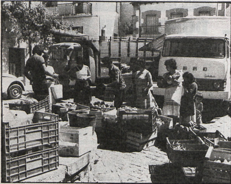
Los mercadillos ambulantes son los más difíciles de controlar desde un punto de vista higiénico

■ Aranjuez y El Escorial tienen los precios más elevados en la mayoría de los productos