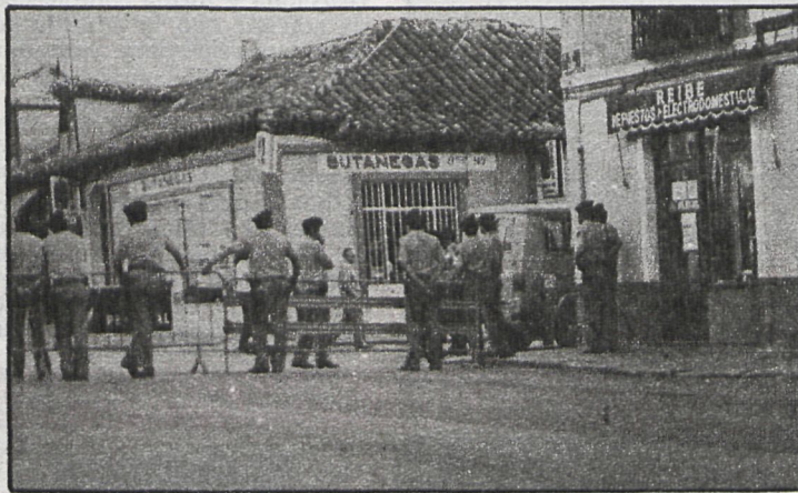
El pasado 18 de julio hubo despliegue policial importante para evitar incidentes en las calles de Aranjuez, y, efectivamente, no intervinieron las fuerzas de orden público en ningún momento

Según fuentes municipales, el pasado martes el Ayuntamiento de Aranjuez llegó a un acuerdo con el Gobierno Civil, por el que se celebraría la concentración en la Plaza de Toros, siempre y cuando que el despliegue policial