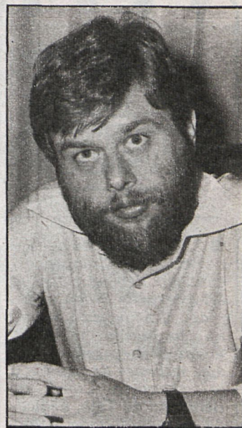
El alcalde de Majadahonda se mantiene alerta y su concejal de Sanidad fue el primero en dar la voz de alarma para que no se siguiese bebiendo el agua hasta no tener la certeza de que era potable

A partir de las noticias alarmantes difundidas por los medios de comunicación, las reacciones surgieron inmediatamente. El alcalde de Pozuelo de Alarcón, uno de los pueblos presuntamente afectados, declaró a CISNEROS que se habían efectuado unos análisis