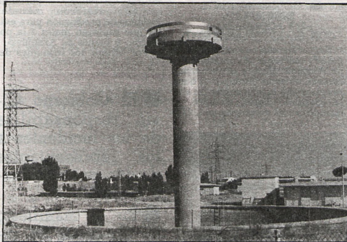
La red que suministra agua a Majadahonda está gestionada por el Canal de Isabel II, que toma la traída del preciado líquido del contaminado embalse de Valmayor