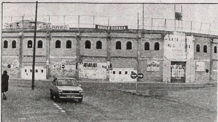
La plaza de toros de San Sebastián ha dado un importante paso para seguir manteniéndose entre las primeras