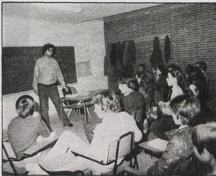
La Universidad Popular de San Sebastián de los Reyes surgió como una alternativa a la enseñanza oficial, y ofrece a los jóvenes una serie de actividades para ocupar su tiempo libre

ben y se inunda todo. También tenemos pensado reparar las calles del pueblo, acondicionarlas y crear otras nuevas que ahora son un barrizal. Para ello hemos pedido un crédito de noventa millones de pesetas a la Caja de Ahorros. Después de este proyecto tenemos pensado «lavar la cara a San Sebastián de los Reyes». No lo hemos hecho antes para que la gente no pensase que se trataba de una campaña de prestigio o que empezábamos por lo más fácil. También vamos a crear una casa de cultura, donde la gente podrá acudir libremente. Para esta obra tenemos un presupuesto de unos noventa millones de pesetas. Una idea bastante inmediata, porque se necesita con urgencia, es la creación de dos guarderías. El Ayuntamiento piensa financiar la obra y que luego funcione en plan de cooperativa. Mire, además pensamos crear un patronato agrícola; en San Sebastián de los Reyes mucha gente vive de la agricultura, y esto servirá para crear nuevos puestos de trabajo, que tanto se necesitan.»