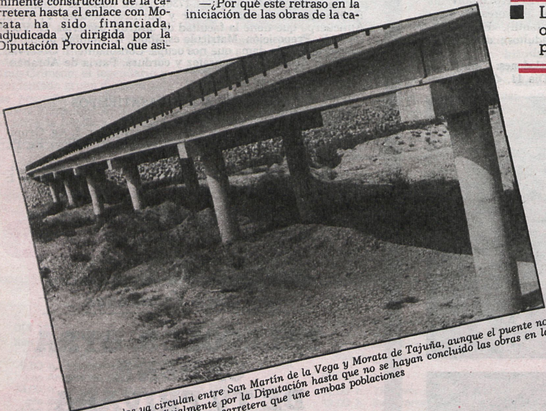
Los vehículos ya circulan entre San Martín de la Vega y Morata de Tajuña, aunque el puente no será inaugurado oficialmente por la Diputación hasta que no se hayan concluido las obras en la carretera que une ambas poblaciones

La Diputación de Madrid ha financiado una de las obras más importantes que se han realizado en la provincia, por valor de doscientos diez millones.