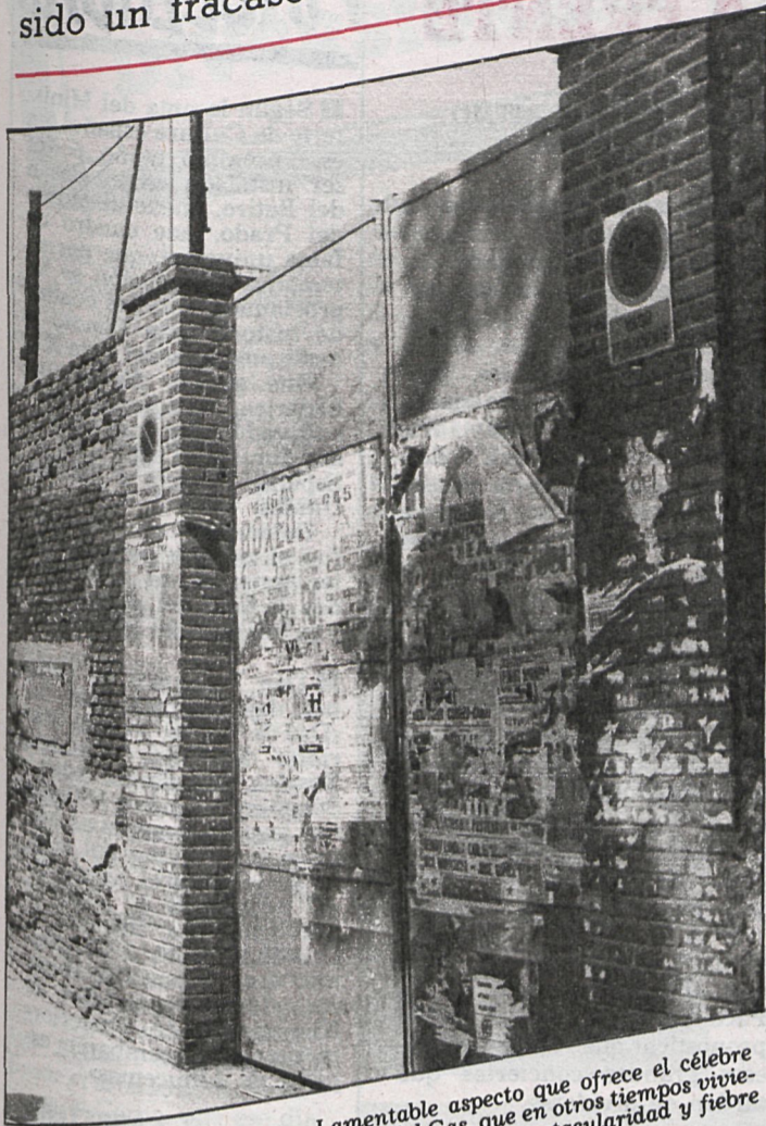
Lamentable aspecto que ofrece el célebre campo del Gas, que en otros tiempos vivió momentos de espectacularidad y fiebre popular

Los combates en el campo del Gas han sido un fracaso este verano