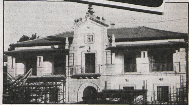
La propuesta del «gran banquete» fue aprobada por el Ayuntamiento de Los Molinos con los votos a favor de UCD y Coalición Democrática, frente a los de PSOE y PCE

Dos concejales del PSOE han dimitido de la comisión de festejos porque consideran inaceptable dedicar medio millón de pesetas a un convite para apenas cien personas, cuando los fondos son necesarios para paliar el desempleo que sufre el pueblo