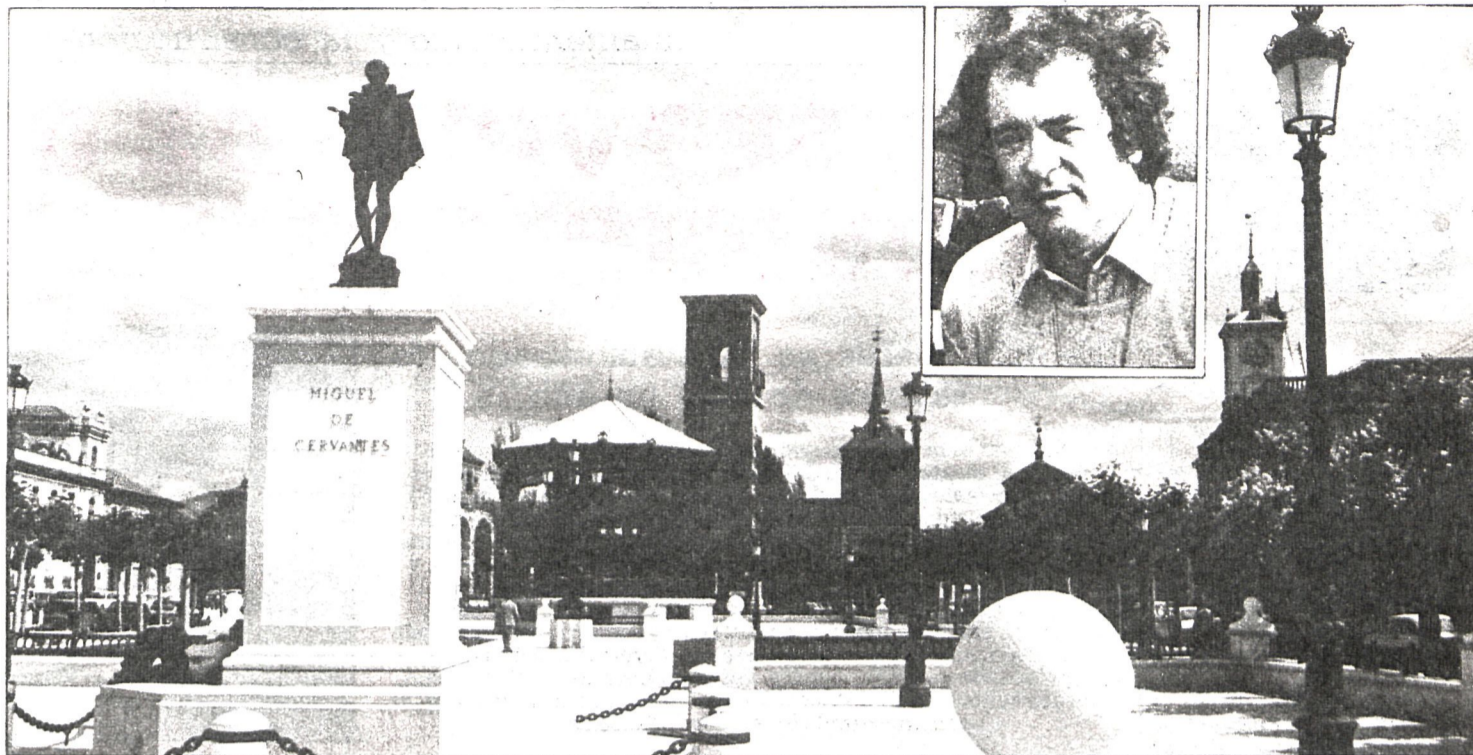
Los organizadores están gestionando su asistencia

Igualmente, Los Santos de la Humosa, en honor de su Virgen, Nuestra Señora de la Humosa, celebra del 8 al 12 sus fiestas patronales. Importantes actos deportivos, culturales, religiosos y taurinos se han programado estos días.