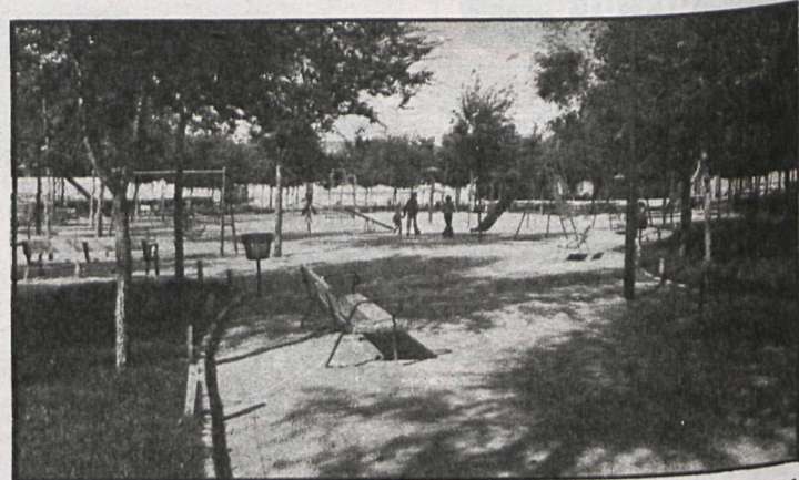
El mantenimiento de los parques entra dentro de las competencias del Servicio de Obras Municipales

—La razón de que el Ayuntamiento contrate empresas privadas es muy simple. Seromal cuenta aún con una plantilla reducida: en total somos treinta y dos trabajadores espe-