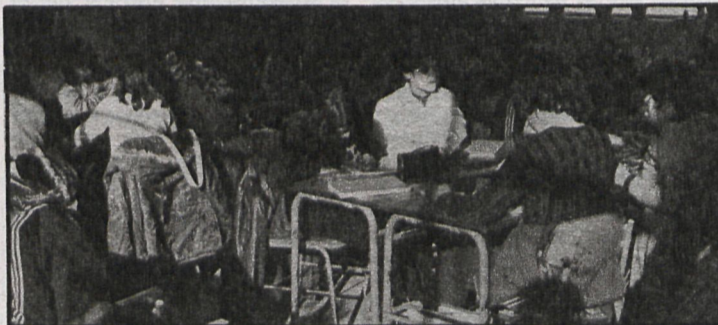
La problemática docente en su más amplia concepción será el tema base del Gabinete Psicopedagógico Municipal