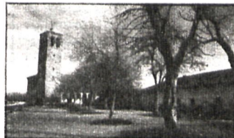
Plaza Mayor de Fresno: Por fin, se acabaron los barrizales

Muy adelantadas van las obras de pavimentación del casco urbano y arreglo de la plaza, que se vienen realizando en Fresno de Torote. Este pequeño pueblo de unos ciento diez habitantes, que se dedica a la agricultura, carecía de aceras y sus calles estaban sin pavimentación alguna, por lo que en invierno se formaba una gran cantidad de barro